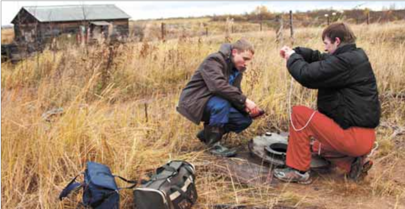
Экологи в очередной раз берут пробы на заброшенном складе бывшей воинской части - в ёмкостях, зарытых в землю, ещё находятся остатки нефтепродуктов.

зора по Архангельской области в марте 2008 года «Архэнерго» был заключен договор с ЗАО «Кратон» на выполнение работ по геоэкологическому обследованию территории склада ГСМ Мезенской ДЭС. Компания «Кратон» выполнила комплекс полевых изысканий, включающий в себя рекогносцировочное обследование территории, бурение скважин, проходку шурфов, гидрогеологические работы, отбор проб грунтов, поверхностных и подземных