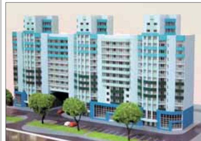
Макет жилого комплекса «Изумруд»

Для легализации работы пилорам и ужесточения требований к их деятельности департаментом лесного комплекса совместно с УВД Архангельской области раз-