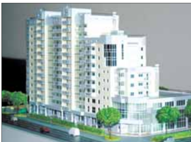
Макет жилого комплекса «Дом на Поморской»

Отсюда – падение спроса на недвижимость. Поэтому начинать новые проекты сейчас невыгодно. Мы, например, имеем отличный новый проект строительства жилого комплекса на 1000 квартир в районе проспекта Московско-