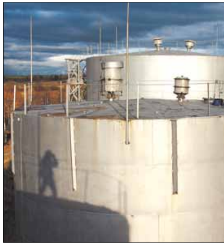
По мнению экспертов, топливный склад Мезенской ДЭС не может быть источником загрязнения Кузнецова ручья.

Нефтепродукты, попавшие в ручей, собирают и утилизируют, но о полной очистке Кузнецова ручья говорить никто не берется - причины попадания в воду загрязняющих веществ