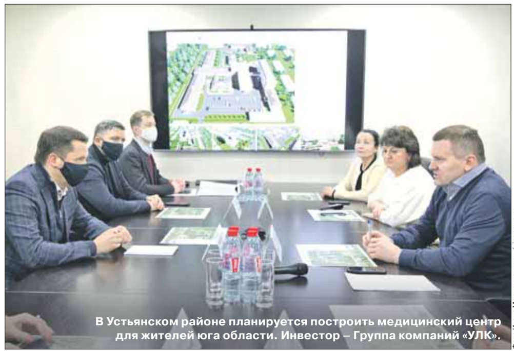
В Устьянском районе планируется построить медицинский центр для жителей юга области. Инвестор – Группа компаний «УЛК».