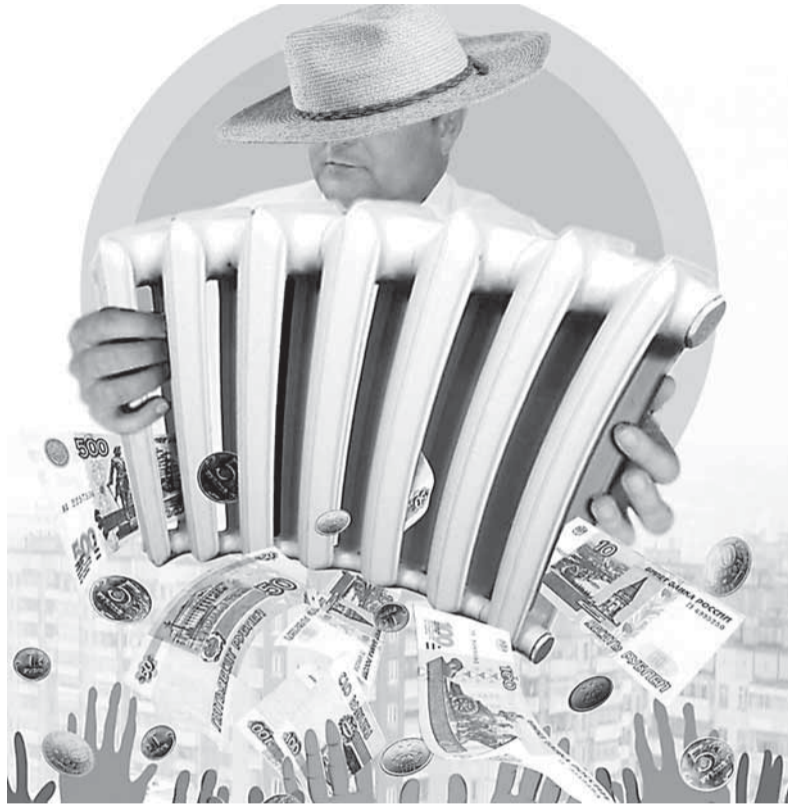
Коплаж из открытых источников, balykovo24.ru

Что интересно, еще в мае 2020 года Александр ЦЫБУЛЬСКИЙ в статусе врио губернатора Архангельской области просил прокурора региона «присоединиться к обсуждению вопросов, касающихся финансового положения «Архоблэнерго». По данным портала rusprofile.ru, в период 2018-2019 годов финансовый результат предприятия упал разом на 1 млрд рублей. Как следует из материалов уголовного дела, обвиняемые намеренно дестабилизировали пла-