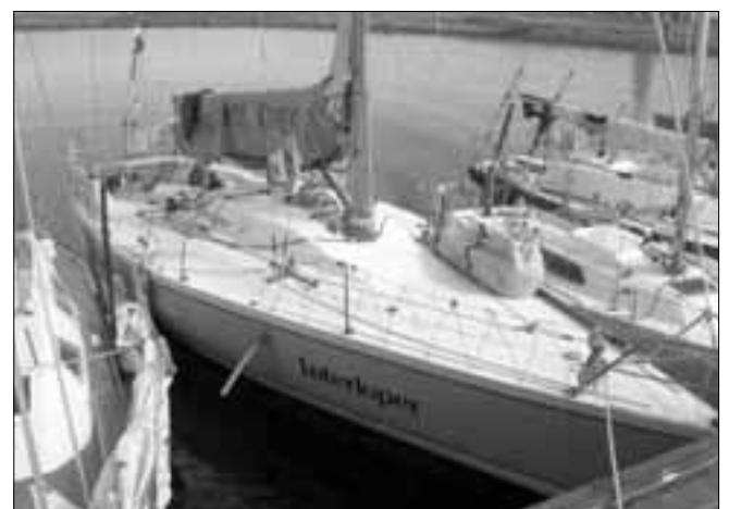
Утешительным призом за стремление к победе награжден экипаж архангельской яхты «Интерлопер». Ведь столь впечатляющий северодвинский финал - результат того, что многолетний лидер гонок вывел из борьбы сразу же после первого этапа.

«На финише первой гонки мы заметили, что яхта значительно потеряла устойчивость,