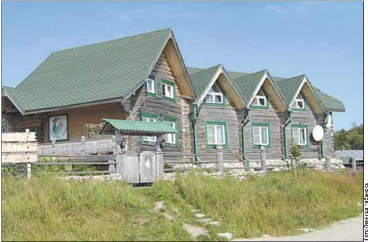
Отель «Зеленая деревня» на берегу Святого озера. Номера - 5 700 рублей в сутки. Полулюкс - 7 500 рублей.

Ни кондиционера (в жару комары летят на разомлевшего туриста, радостно поплывавая в сторону «Фумитокса»), ни выхода в Интернет, ни, в конце концов, утехи халаящика – шведско-