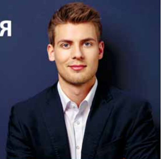
АКБ «РОССИЙСКИЙ КАПИТАЛ» (ПАО), Реклама.