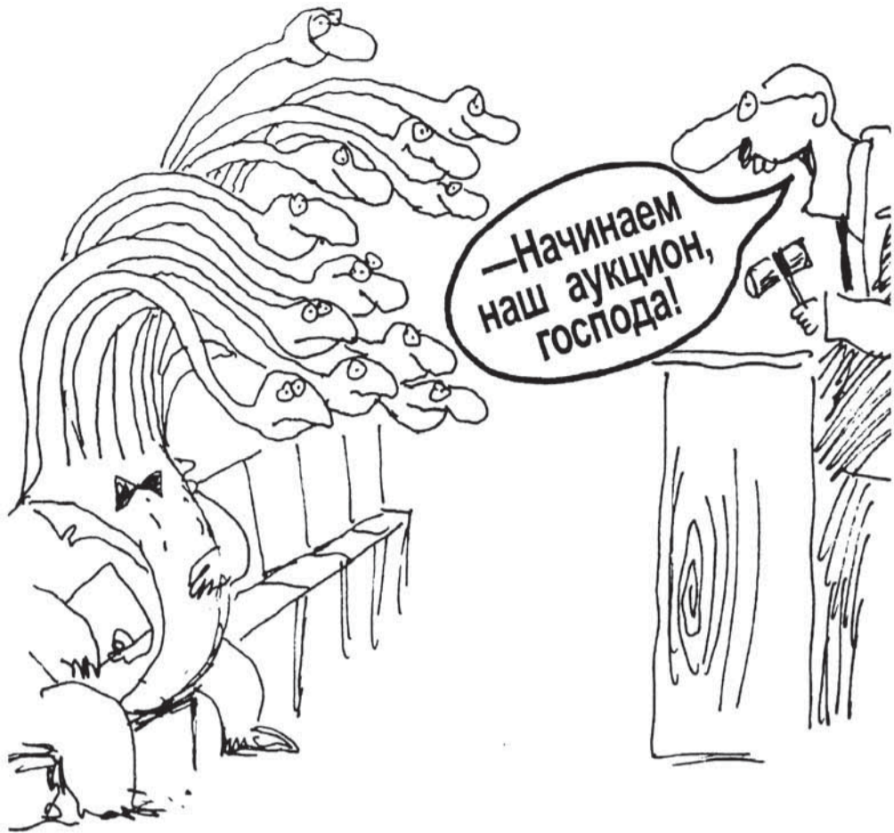
Рис. Виктора Богорада. www.cartoonbank.ru

ственного обсуждения проекта приказа «Об установлении порядка определения начальной (максимальной) цены контракта, а также цены контракта, заключаемого с единственным поставщиком...» (документ опубликован на портале regulation.gov.ru). Но, по словам представитель органов МСУ, он не решит озвученных проблем. Разработчики предлагают формировать цену контракта исходя из себестоимости работ перевозчика; планируемой суммы сбора платы за проезд пассажиров; прибыли; планируемых субсидий на компенсацию недополученных доходов от предоставления льгот на проезд пассажиров. Все это опять-таки не укладывается в систему сложившихся отношений между властью и бизнесом в сфере пассажирских перевозок Архангельской области, где убытки перевозчикам не компенсируются.