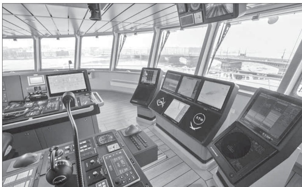
Современные суда строятся по государственной программе инвестиционных квот. Каждый траулер будет гарантированно задействован на промысле.

А после церемонии «Баренцево море» отправится на испытания и затем – на полноценный промысел в Северном рыбохозяйственном бассейне.