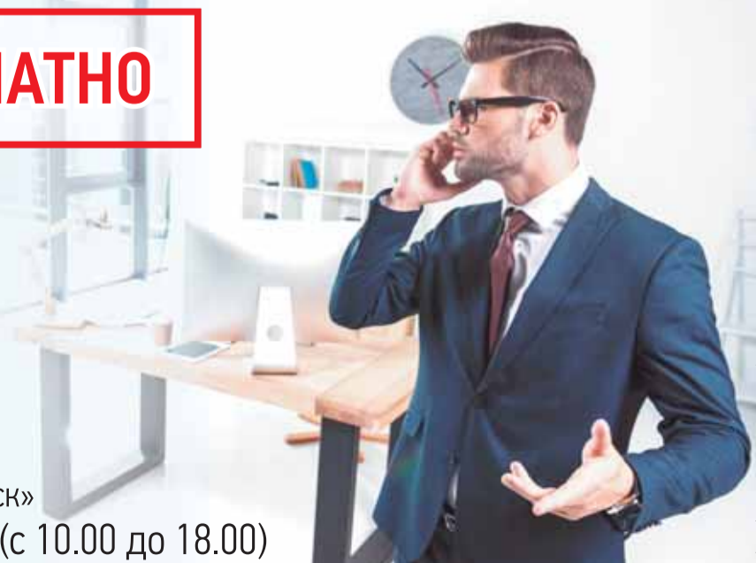
Фото depositphotos.com, Репина, Не является публичной офертой.

БК Ваш «БИЗНЕС-КЛАСС Архангельск» Звоните: (8182) 65-25-40 (с 10.00 до 18.00)