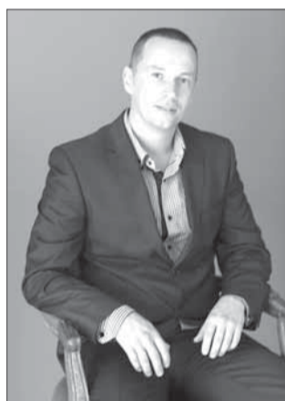
Один из ярких примеров создания франшизы в регионе – северодвинская студия Total Body. Сегодня под ее брендом открыты компании в Калининграде и Архангельске.

«Потребность рынка в нашем продукте очевидна. Мы делаем упор на групповые тренировки: это фитнес, йога, современные танцы, акробатика, стретчинг. Созданием франшизы занимались в период пандемии, не теряли времени – прописали все бизнес-про-