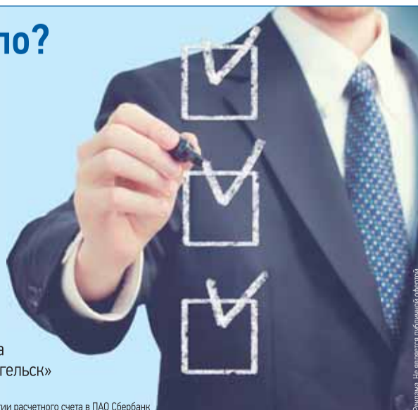
Реализм. Не является публичной офертой.

*при открытии расчетного счета в ПАО Сбербанк