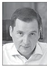
Александр ЦЫБУЛЬСКИЙ, губернатор Архангельской области:

– Диапазон проектов в регионе очень широкий: от отельного бизнеса до транспортно-логистической ниши. Каждая такая инициатива имеет большое значение. Архангельский транспортный узел – один из самых исторически важных в России, и его развитие необходимо увязать с экономикой, образованием и наукой. Архангельск и весь регион имеют все возможности стать важной точкой на карте в рамках развития Северного морского пути и обеспечения поставки товаров на мировые рынки.