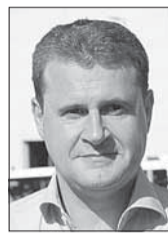
Алексей ЧЕКУНКОВ, министр РФ по развитию Дальнего Востока и Арктики:

– Диапазон проектов в регионе очень широкий: от отельного бизнеса до транспортно-логистической ниши. Каждая такая инициатива имеет большое значение. Архангельский транспортный узел – один из самых исторически важных в России, и его развитие необходимо увязать с экономикой, образованием и наукой. Архангельск и весь регион имеют все возможности стать важной точкой на карте в рамках развития Северного морского пути и обеспечения поставки товаров на мировые рынки.