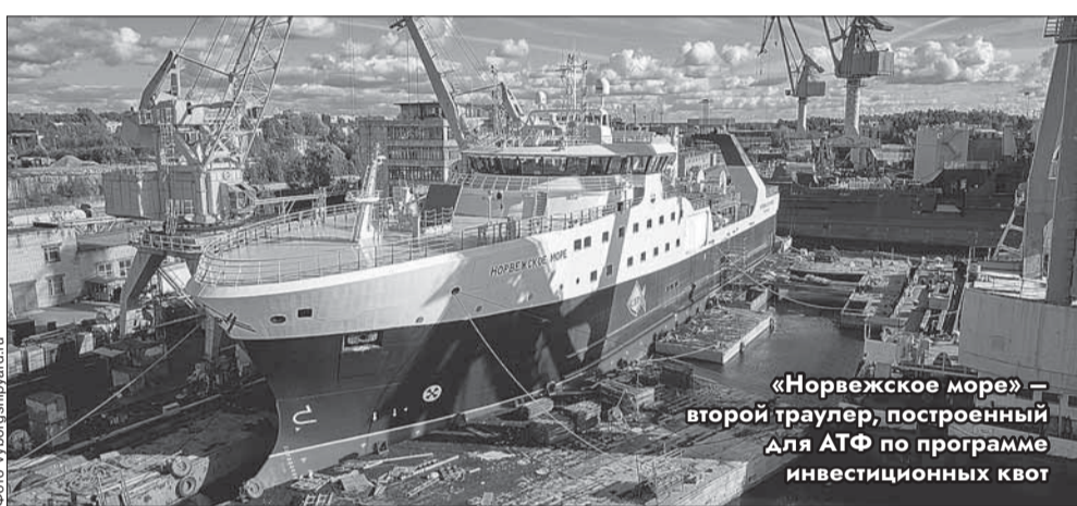
«Норвежское море» – второй траулер, построенный для АТФ по программе инвестиционных квот

Однако я считаю, что аргументы ряда депутатов, профессионального сообщества и регионов услышаны. В постановлении Госдумы «О проекте федерального закона № 173016-8 «О внесении изменений в Федеральный закон «О рыболовстве и сохранении во-