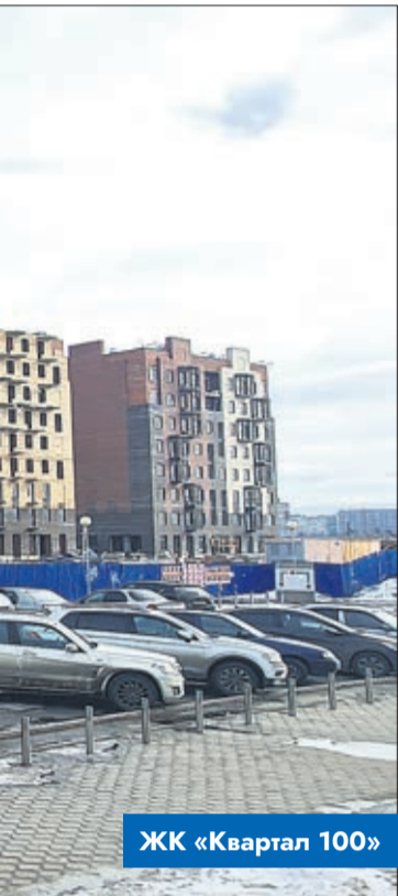
ЖК «Квартал 100»