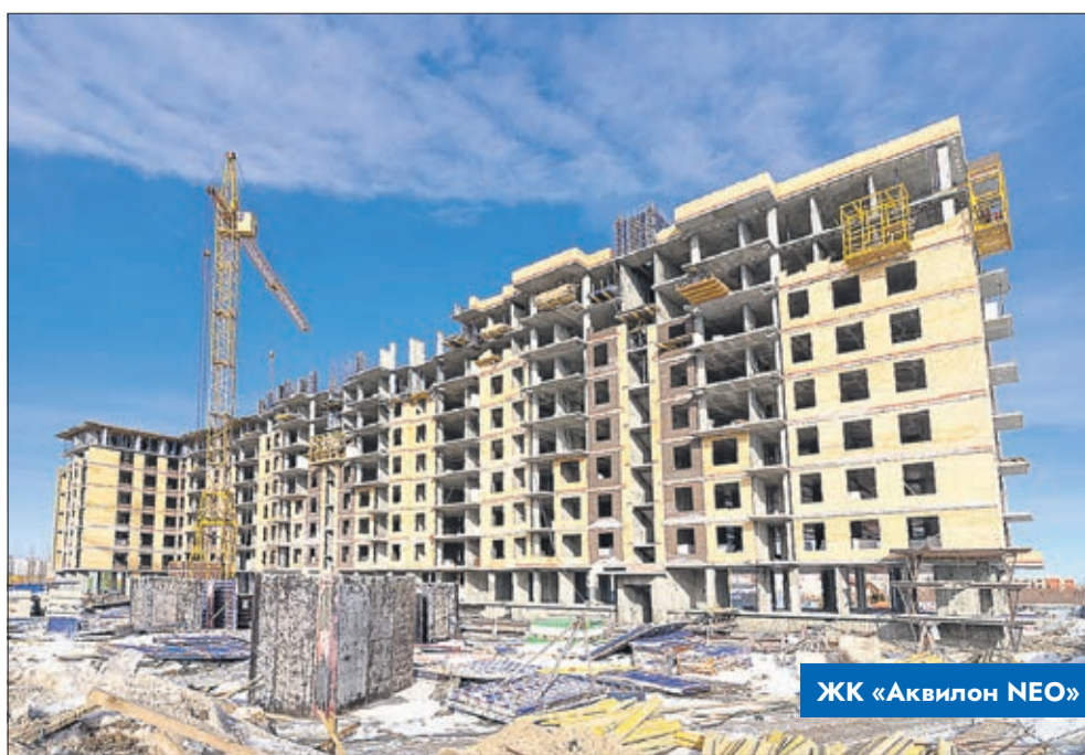
ЖК «Аквилон NEO»

Само здание детского сада с ярким фасадом уже построено и радует глаз. Можно не сомневаться: многие родители захотят отдать своих дошколят в это новенькое, уютное уч-