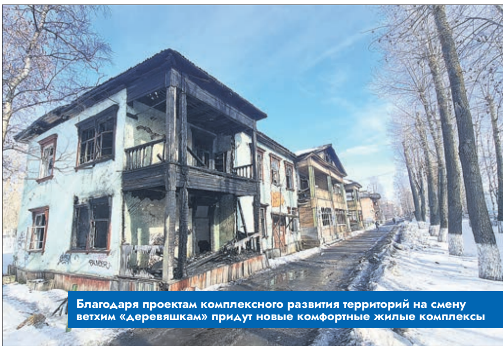
Благодаря проектам комплексного развития территорий на смену ветхим «деревяшкам» придут новые комфортные жилые комплексы