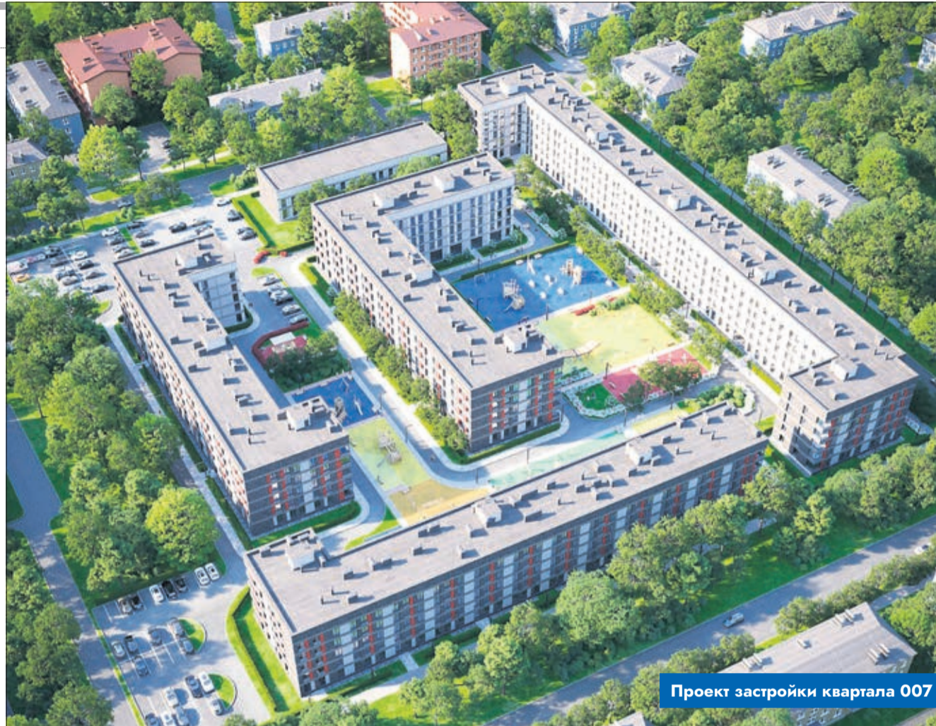
Проект застройки квартала 007

Также сейчас Группой Аквилон в Северодвинске реализуются два масштабных инвестиционных проекта – «Квартал 100» и «Аквилон NEO». Напомним, что обладание этим статусом также накладывает на застройщика ряд социальных обязательств.