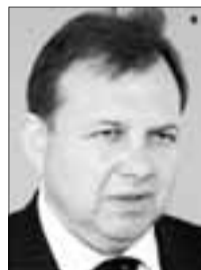
Виктор ПАВЛЕНКО, мэр Архангельска:

Реальная потребность - не шесть, а около 20 млрд рублей. Мы можем сделать земельный налог «поголовным», можем оптимизировать использование муниципального имущества, но получим дополнительно лишь около 50 млн рублей. На сегодня, пожалуй, это все собственные резервы.