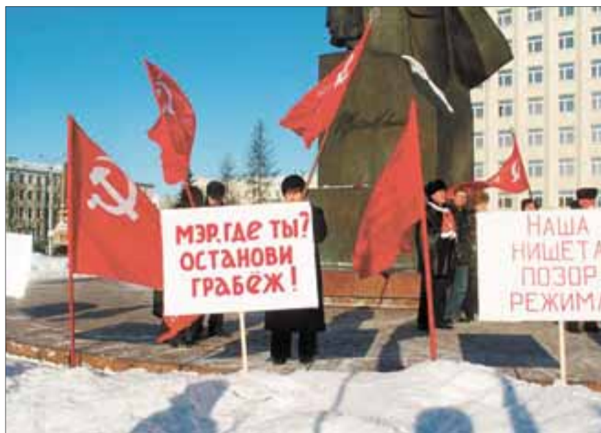
В прошлом году в Архангельске митинги против роста тарифов ЖКХ были гораздо многочисленнее. 26 марта 2011 года КПРФ удалось собрать чуть более ста человек.

Архангельск узнал, что такое «интернет-революция», на год раньше Египта и Ливии. В прошлом году на площади Ленина проводились митинги, собранные именно через Интернет. Разумеется, главной причиной большой явки был рост тарифов на услуги ЖКХ. В этом году в феврале тоже ожидалось увеличение протестной активности: тарифы вновь скакнули вверх. Однако в минувшие выходные на площади Ленина собралось чуть более ста человек.