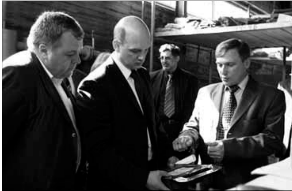
Участники учебно-методического сбора осматривают аварийный запас электрооборудования «Архэнерго».