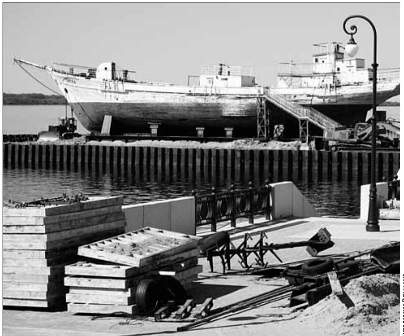
Красную пристань в Архангельске приводят в порядок уже несколько лет. Морской музей обещают открыть для посетителей до конца 2010 года. А вот на шхуне «Запад» реконструкция еще даже не началась - готовится лишь проект.

Итак, по словам чиновников, заветный час совсем близок — Архангельску нужно подождать еще примерно год, чтобы насладиться экспозициями музея и красотой отреставрированной шхуны «Запад», которая с течением времени превращается в памятник безответственного отношения к истории и культуре Поморья.