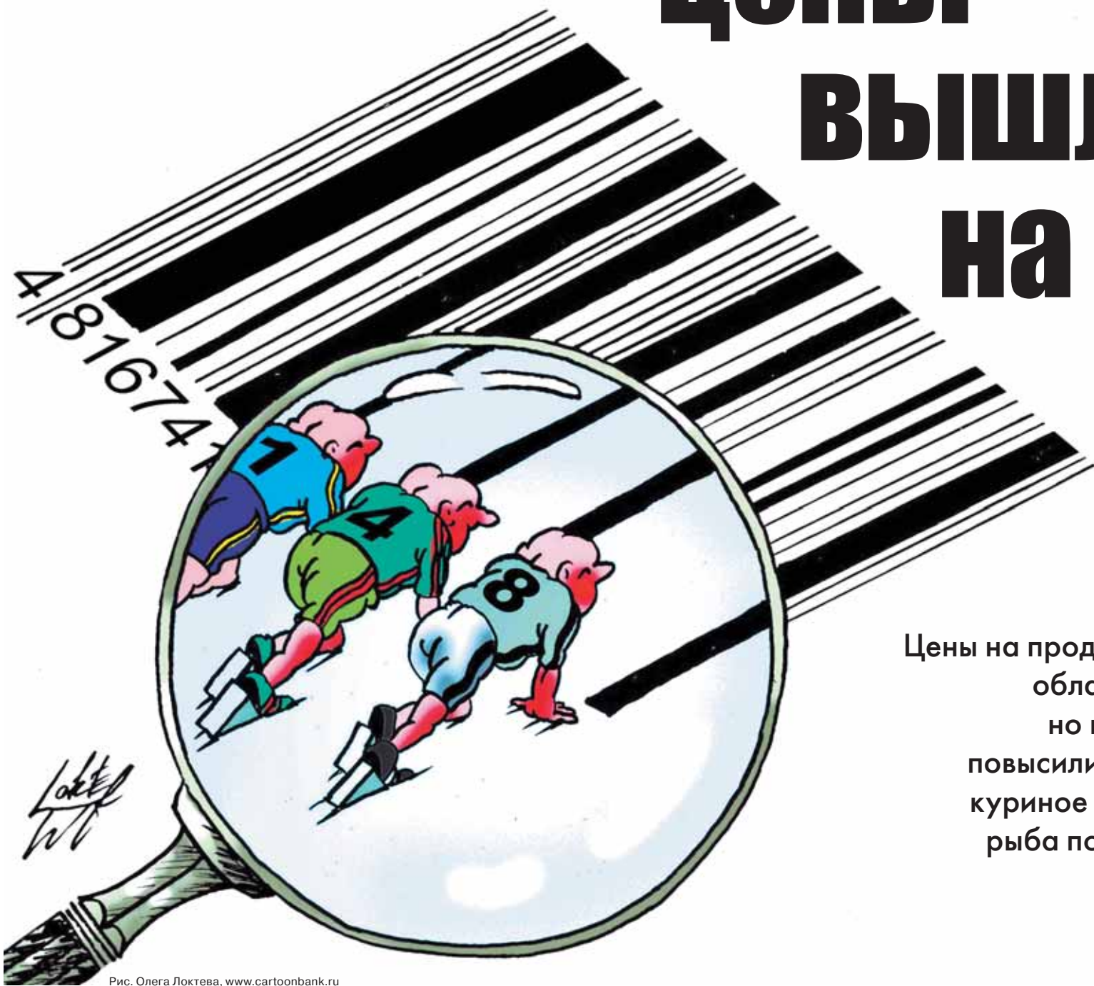
Рис. Олега Локтева, www.cartoonbank.ru

Цены на продукты в Архангельской области резко не выросли, но на отдельные позиции повысились серьезно. Свинина, куриное мясо и замороженная рыба подорожали на 15-18%.