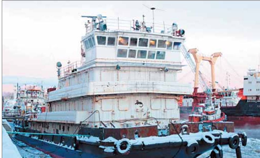
Этим летом силами ГК «Оптимист» и членами НП «Красная кузница» завершена работа по восстановлению под класс морского регистра (РМРС) двух буксиров-толкачей.

На днях мне пришлось общаться с представителем Союза рыбаков колхозов. В разговоре была затронута тема строительства и ремонта траулеров: менеджер с удивлением узнал, что на территории развалившегося советского судоремонтного завода «Красная кузница» в Архангельске работают несколько предприятий, объединенных в единое некоммерческое товарищество. В кооперацию под брендом «Красная кузница» вошли 16 промышленных предприятий и Архангельский техникум водных магистралей имени С.Н. Орешкова.