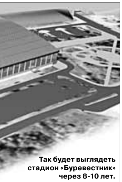
Так будет выглядеть стадион «Буревестник» через 8-10 лет.

Вот только продукция этого производства, скорее всего, будет отправляться на экспорт. В Архангельской области рынок потребления пеллет и брикетов не сформирован. Единственный пример - это лесозавод №25, который ведет переговоры с администрацией Приморского района о взятии в управление 4-7 котельных: их можно перевести на использование пеллет и затем подавать теплоэнергию в коммунальные сети, тем самым обеспечив себе сбыт.