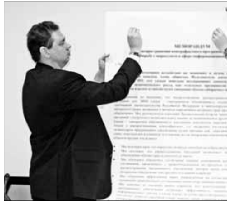
Центры занятости готовы помочь будущим предпринимателям на старте бизнеса.

Решение о выделении денег на открытие дела принимает комиссия, в состав которой входят специалисты Центра занятости, представители мэрии Архангельска и администрации Приморского района. После этого, если комиссия одобрит бизнес-идею, на счет гражданина будет перечислено 58 800 рублей. За их расход впоследствии он должен будет отчитаться. Одно из ключевых условий программы - гражданин, получивший финансовую по-