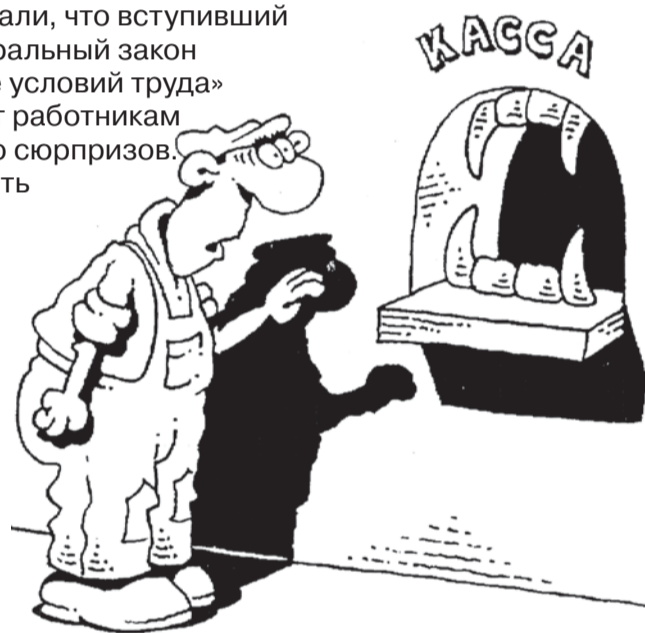
Рис. Игорь Кийко, www.cartoonbank.ru

Аттестация рабочих мест и ранее проводилась примерно в трети от общего числа организаций области. Таково отношение работодателей к здоровью работников. Результаты проведенных аттестаций могут быть использованы в течение пяти лет с момента подведения их итогов. Специальную оценку условий труда в этом случае можно не проводить, если, конечно, ничего не изменилось