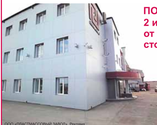
ООО «ПЛАСТМАССОВЫЙ ЗАВОД». Реклама.

г. Архангельск, ул. Стрелковая, 19 тел.: 8-911-598-88-42, (8182) 65-75-59