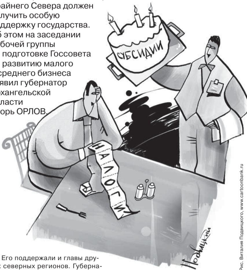
Рис. Виталия Подвицкого, www.cartoonbank.ru

Малый и средний бизнес в районах Крайнего Севера должен получить особую поддержку государства. Об этом на заседании рабочей группы по подготовке Госсовета по развитию малого и среднего бизнеса заявил губернатор Архангельской области Игорь ОРЛОВ.