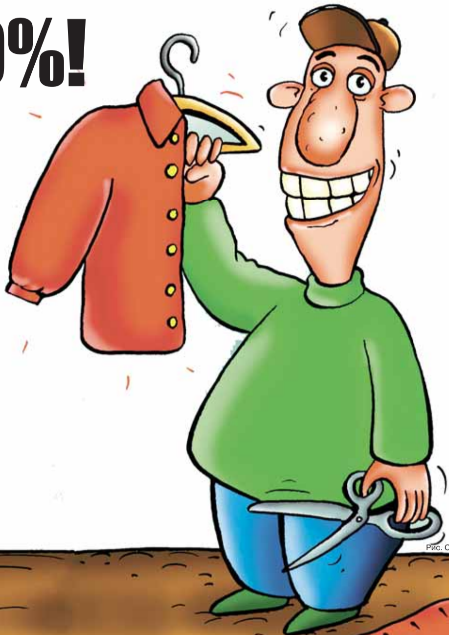
Рис. Сергея Соколова, cartoonbank.ru

В Архангельской области вводятся «налоговые каникулы» для начинающих предпринимателей - тех, кто занимается туризмом, ремонтом мебели, гравёрными работами, изготовлением колбас, переработкой сельхозпродуктов, организацией образовательных курсов, спортивных занятий и т. д. Новый закон, если его примут депутаты, вступит в силу уже в начале апреля. По оценкам минфина, нулевыми ставками уже в этом году смогут воспользоваться 250 ИП.