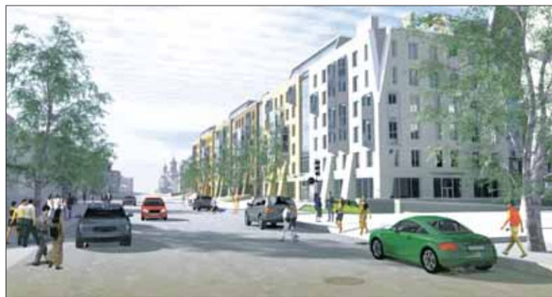
Коммерческие площади на первых этажах жилого комплекса «Омега-Хаус» можно выгодно приобрести уже сейчас.

Нежилая недвижимость расположена на первых этажах жилого комплекса «Омега-Хаус», который возводится в самом центре Архангельска на набережной Северной Двины, между улицами Поморской и Володарского. Будущий владелец получит торговую площадку с уже развитой инфраструктурой: рядом ТЦ «Европарк», многофункциональный комплекс DELTA, включающий три блока – бизнес-центр, гостиницу международной сети Novotel и апартаменты, продажу которых уже запустил девелопер. Еще один аргумент в пользу инвестиций в коммерческую недвижимость холдинга – современная планировка помещений, их отделка и возможности для многоцелевого использования. Инвестиционной привлекательности недвижимости добавляет и высокая покупательная способность будущих жильцов DELTA.