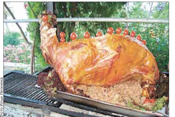
Барашек, фаршированный пловом, по-армянски. Запекается целиком на вертеле, на живом огне. Минимальное количество – 30 порций.

Если же ваш офис не совсем подходит для празднования новогоднего корпоратива, душа просит шоу, танцев – добро пожаловать в