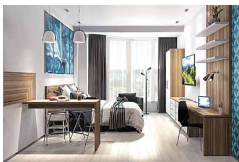
Средняя годовая доходность апартаментов составит от 10 до 15%

Добавьте к этому прекрасный вид из окна на реку и расположение в самом центре столицы Поморья. Семизэтажный комплекс DELTA с панорамным остеклением расположен на берегу Северной Двины, буквально в 20 метрах от воды. Близ комплекса находятся все объекты городской инфраструктуры, но, несмотря на это, кажется, что он на тысячи километров удален от шума и суеты города. DELTA Apartments имеет соб-