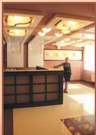
Реклама ООО "Новый век".