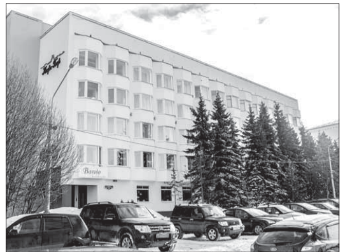
Гостиница «Столица Поморья», которой управляет региональный Фонд имущества и инвестиций, прошла сертификацию в июле 2016 года и получила категорию ★★.

С деловыми целями в область приезжает более 44% гостей: значит, нужны конференц-залы, переговорные. Туристов 17% – им нужно предлагать интересные