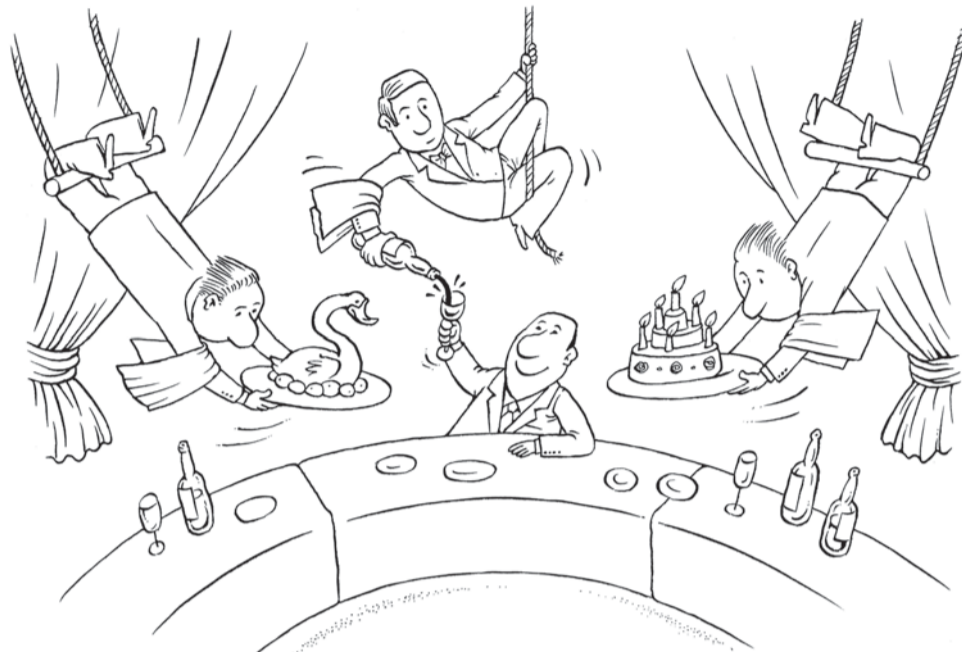
Рис. Максим Смирнов, www.cartoonbank.ru

В 1970-80-х годах пятую часть денег, составляющих расходы на питание, житель Советского Союза тратил в столовых, кафе и ресторанах. В 2017 году этот показатель равнялся лишь 9%. Как считают в Минпромторге РФ, причина кроется не в снижении финансовых возможностей населения, а в отсутствии достаточного количества доступных разноформатных объектов общепита. Чтобы решить эту проблему, министерство предлагает принять «Стратегию развития предпринимательства в сфере питания вне дома на период до 2025 года» (далее – Стратегия). Что думают о ней владельцы кафе и ресторанов в Архангельской области?