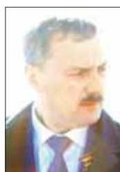
Игорь ГОДЗИШ, глава Архангельска:

– Город – это не только жилые дома, социальные учреждения и муниципальные дороги. Здесь развивается и строит дальнейшие планы бизнес. И сейчас мы видим качественные изменения: все больше предприятий и предпринимателей становятся участниками проектов по благоустройству территорий. Это делается частью разумной стратегии компаний: улучшая городское пространство, они создают условия для сохранения своего кадрового потенциала, формирования собственной корпоративной этики.